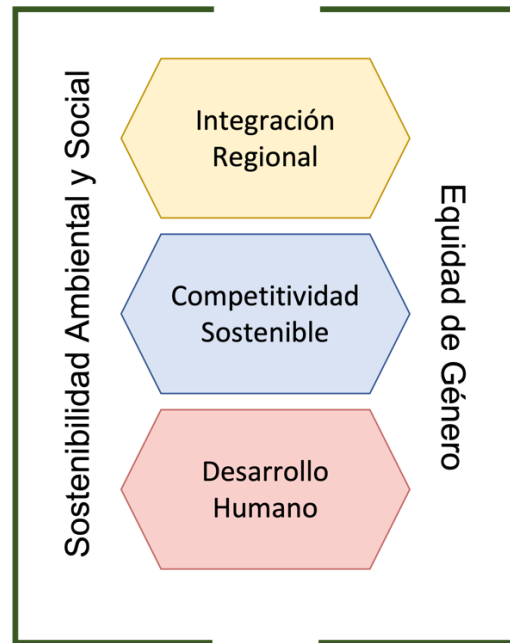
Figura 2 Ejes de Estrategia Institucional BCIE 2020-2024

Fuente: Elaboración propia a partir de la Estrategia Institucional BCIE 2020-2024