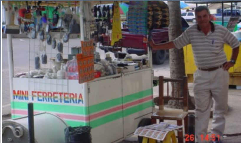
Mini Ferretería - Microempresa Afectada por Desastres Naturales

D ebido a su posición geográfica, la región centroamericana es una de las regiones con mayor probabilidad de ocurrencia de amenazas naturales: terremotos, erupciones volcánicas, inundaciones, sequías, deslizamientos, huracanes, depresiones tropicales, entre otros.