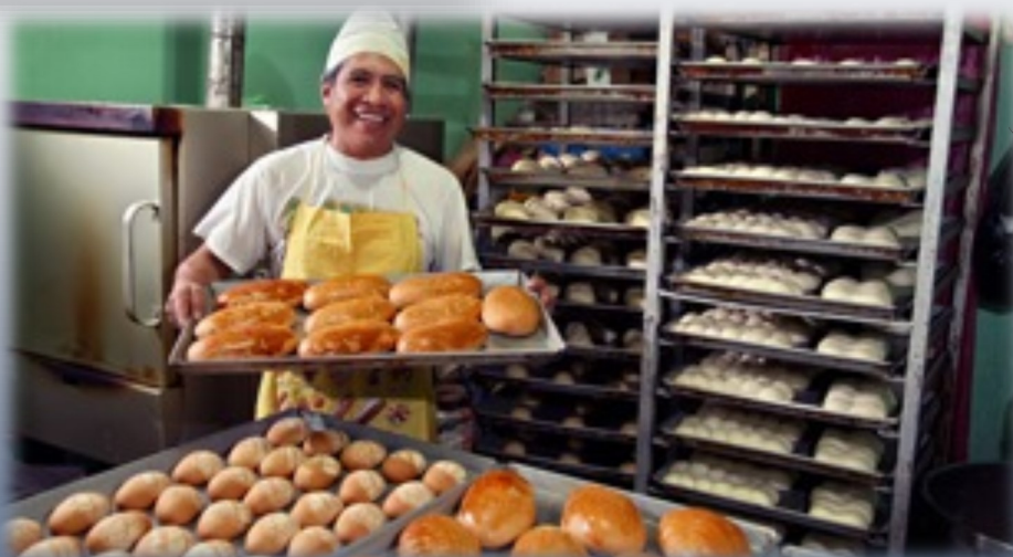
Beneficiario del Programa de Apoyo a la MIPYME Afectada por Desastres Naturales

FINAM EN PERSPECTIVA - DESASTRES NATURALES 2016