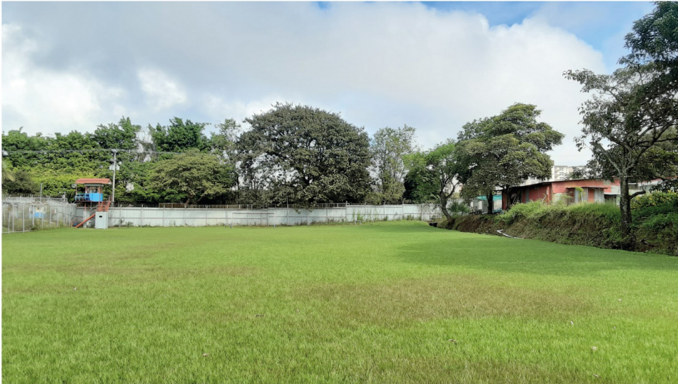
Terreno que albergará el Proyecto Edificio Monitoreo Policía Penitenciaria, en el lugar actualmnete se ubica una cancha de fútbol.