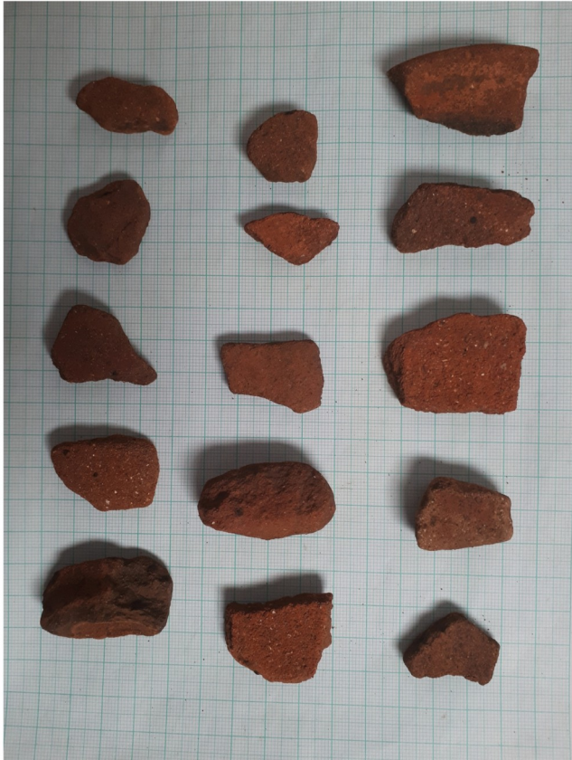
Cuerpos y bordes cerámicos

Restos de cerámica arqueológica registrada en el terreno donde se construirá el Conjunto Máxima