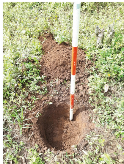
Pozo de cateo excavado en el terreno donde se ubicará el Proyecto Conjunto Máxima.