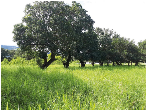
Panorámica del área que requiere supervisión de movimientos de tierra, en los terrenos donde se ubicará el Proyecto Conjunto Máxima.