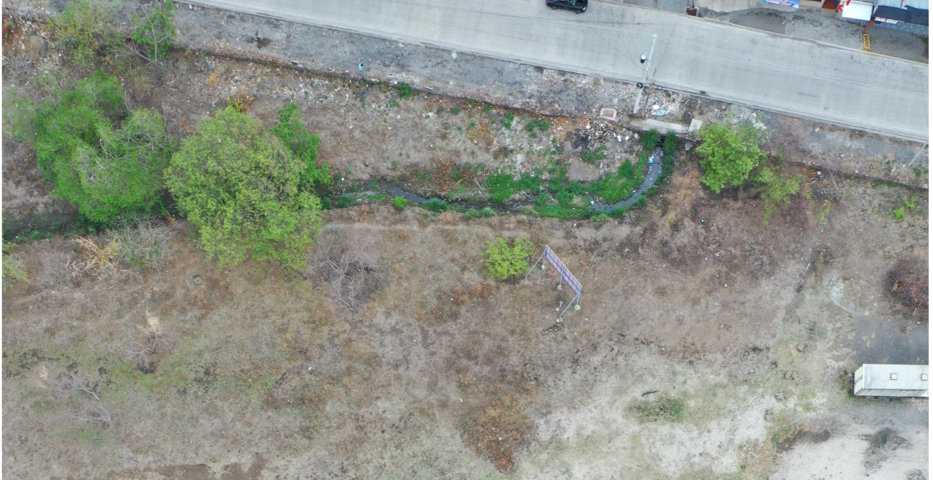
Fotografía N°1. Vista aérea ingreso de aguas residuales (fecha 19/05/2019).

El proyecto del nuevo Hospital contempla el diseño y construcción de una solución para el manejo de las aguas pluviales de las calles frente a la propiedad donde se desarrollará el proyecto, pero no se incluye el tratamiento de aguas residuales externas al nuevo Hospital.