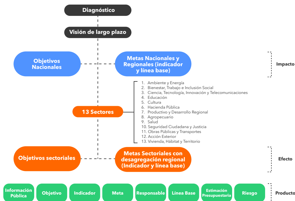
Figura 1 Diagrama de Componentes PNDIP 2023-2026

Fuente: Elaboración propia con base en PNDIP 2023-2026