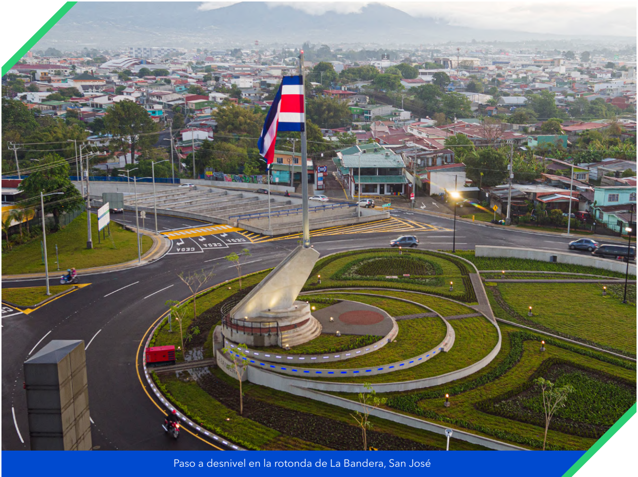
Paso a desnivel en la rotonda de La Bandera, San José

publicados por la Superintendencia General de Entidades Financieras (SUGEF). Este crecimiento en saldo de cartera fue inferior al período fiscal anterior de 4.4% anual en 2021, y retrocede a niveles similares al período anual 2020 cuando aumentó 3.1%. Las instituciones financieras (IFIs) tienen niveles adecuados de capitalización y liquidez; sin embargo, siguen siendo vulnerables al elevado endeudamiento de los hogares y a la alta dolarización del crédito.