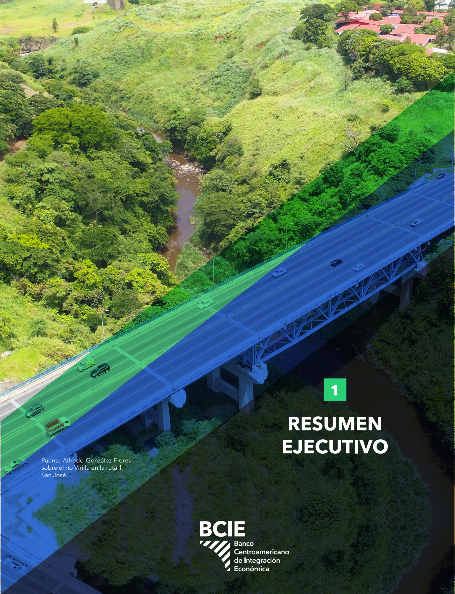
Puente Alfredo González Flores sobre el río Virilla en la ruta 1, San José