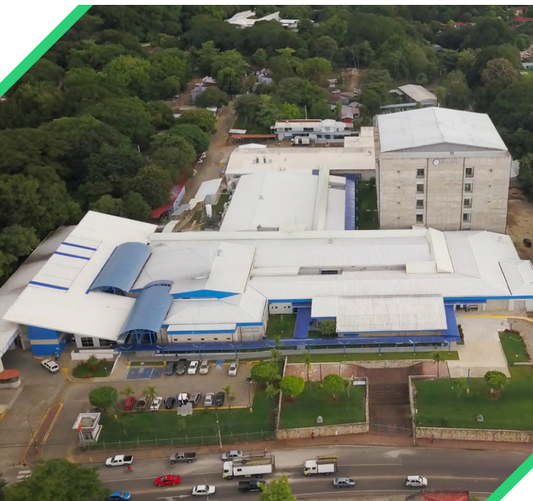
Hospital La Anexión Costa Rica

El Banco apoyará a las entidades de sector privado y entidades públicas no soberanas en el desarrollo de proyectos priorizados por el sector público, relacionados con transporte, energía, infraestructura vial, puertos, aeropuertos y servicios conexos, telecomunicación, agua y saneamiento, salud, educación, entre otros, que permitan promover la infraestructura competitiva y las condiciones óptimas para incentivar el crecimiento económico y social inclusivo en el país.