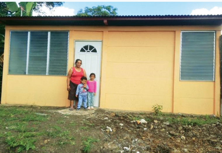
Villa Sandino, Chontales.