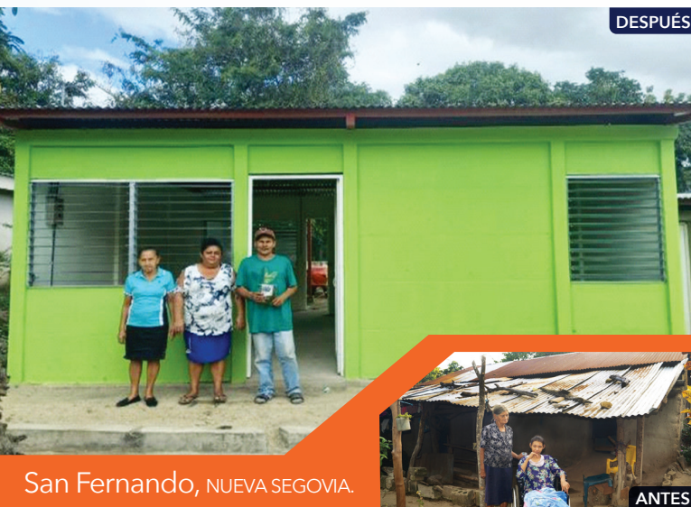
San Fernando, NUEVA SEGOVIA.