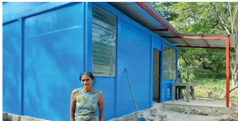
San Lucas, Madriz.

El 50% de los beneficiarios directos han sido hogares liderados por mujeres.