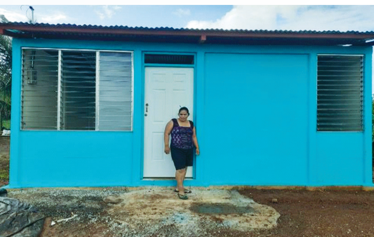
Kukra Hill, RACCS.