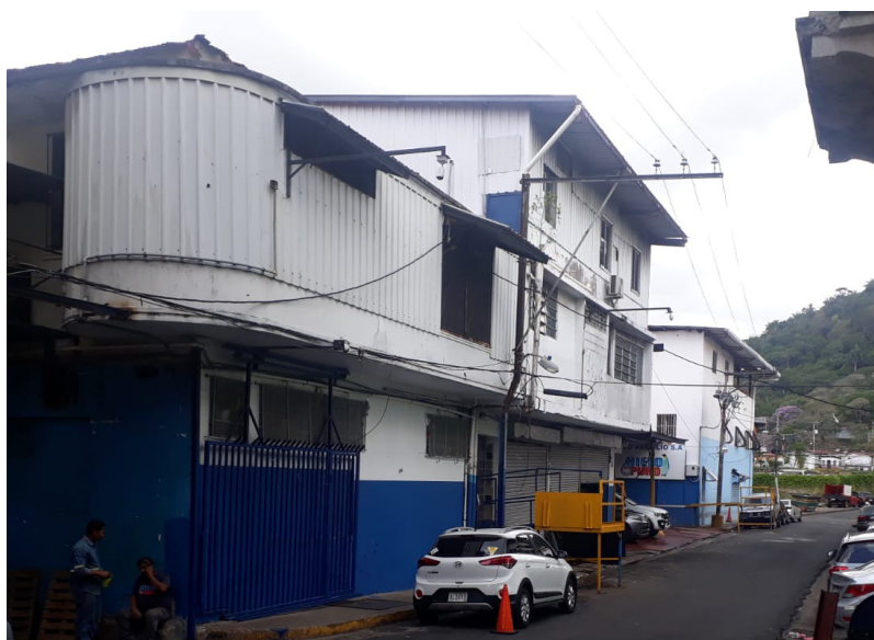
Hielo Ameglio, Santa Ana, Ciudad de Panamá.

Las principales actividades económicas en la que se desarrollan las empresas de este sector son: comercio al por mayor y al por menor, hoteles y restaurantes, construcción e industria manufacturera.